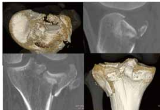
CT検査をおこなうと3D画像などにより立体的に骨折部を理解できます