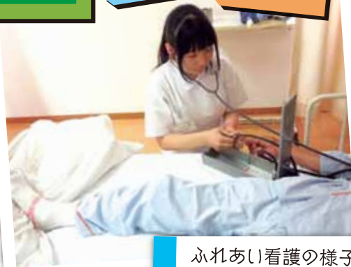
ふれあい看護の様子

平成24年5月30日(水)に、8名の高校生が当院に職場体験に来られ、当病棟では3年生2名と2年生1名を受け持たせて頂きました。初めのうちは緊張された様子でしたが、入院患者さまとお話をされていくうちに次第と緊張がほぐれていき、笑顔が見られるようになりました。実際に患者さまの清拭介助や洗髪介助、検温の実施やリハビリ見学・松葉杖で歩くことなど色々な体験を行ってもらいました。