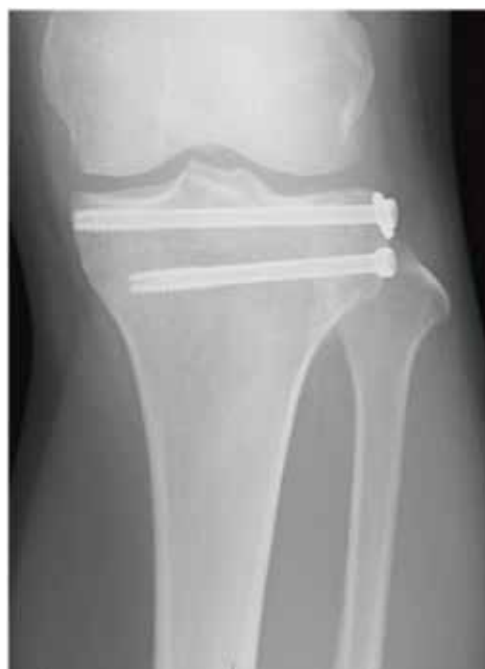
関節鏡視下法：スクリュー固定