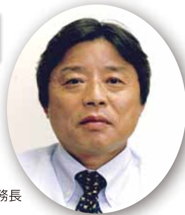
福岡整形外科病院 事務長