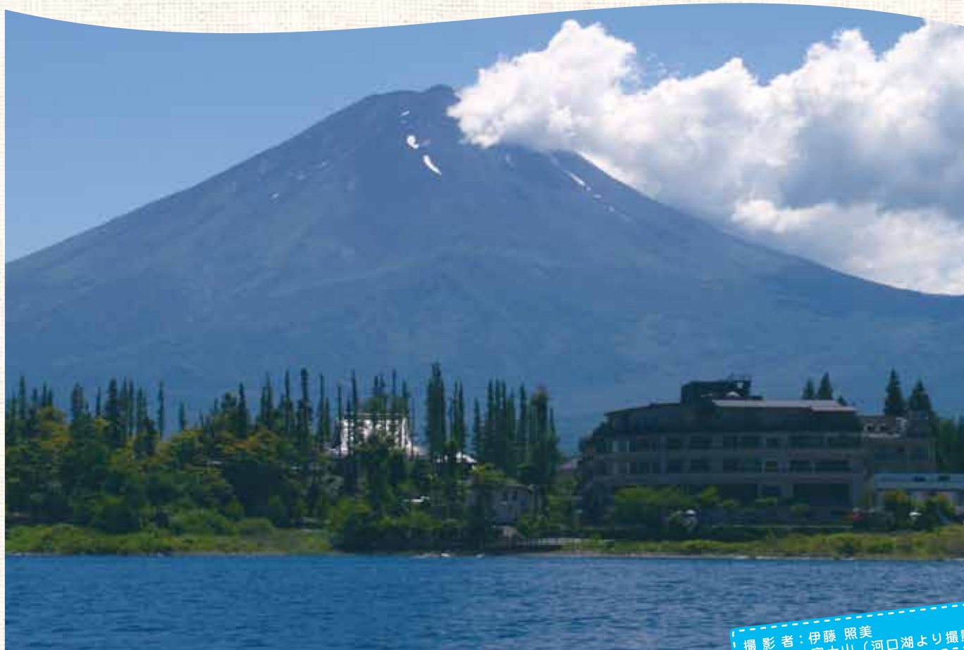
撮影場所：富士山（河口湖より撮影）

サ・エ・ラはフランス語で「ここかしこ」を意味し皆様と病院の情報提供・交換をモットーとするものです。