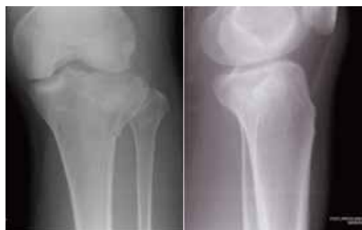
レントゲン正面像